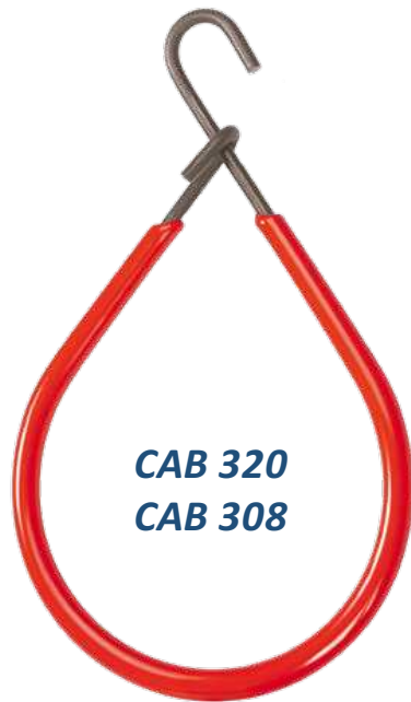
CAB 320 CAB 308