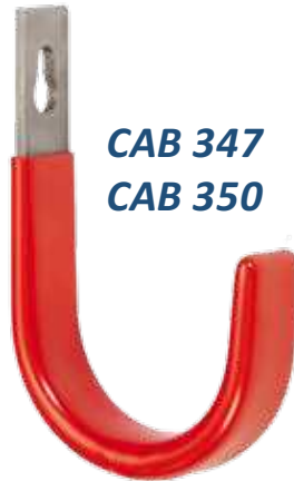
CAB 347 CAB 350