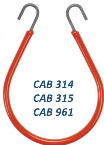
CAB 314 CAB 315 CAB 961