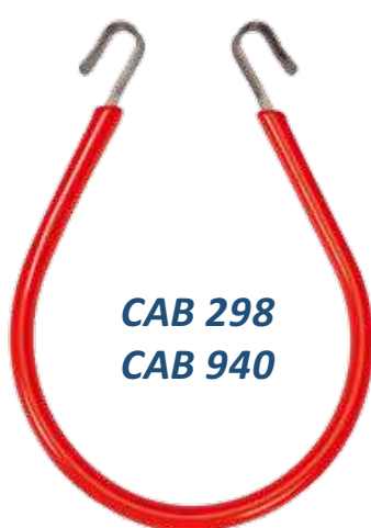
CAB 298 CAB 940