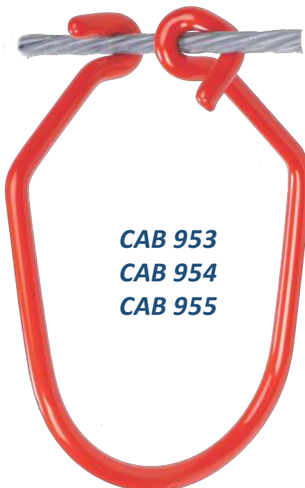
CAB 953 CAB 954 CAB 955

CAB 824 102mm Ø x 230mm L CAB 825 127mm Ø x 279mm L CAB 826 152mm Ø x 300mm L