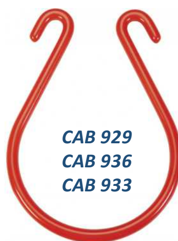
CAB 929 CAB 936 CAB 933

CAB 314 92mm Ø x 165mm L CAB 315 114mm Ø x 187mm L CAB 961 152mm Ø x 279mm L